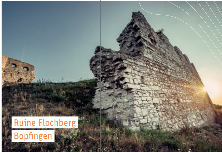
Ruine Flochberg Bopfingen