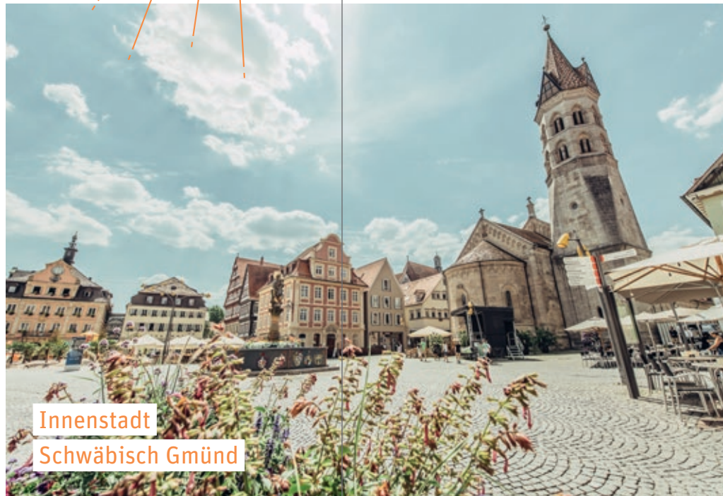
Innenstadt Schwäbisch Gmünd