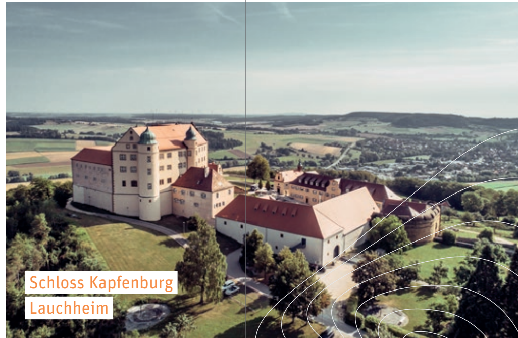
Schloss Kapfenburg Lauchheim