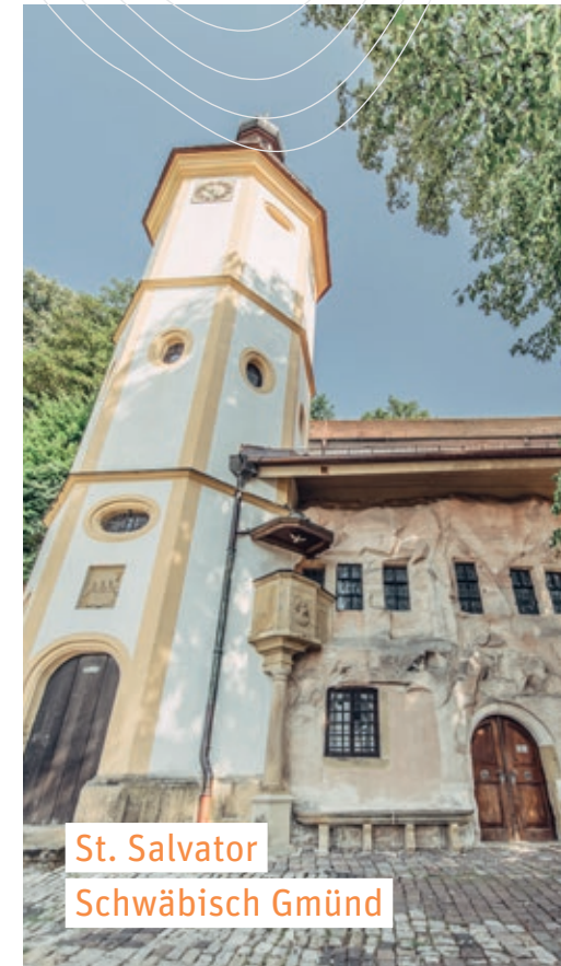
St. Salvator Schwäbisch Gmünd