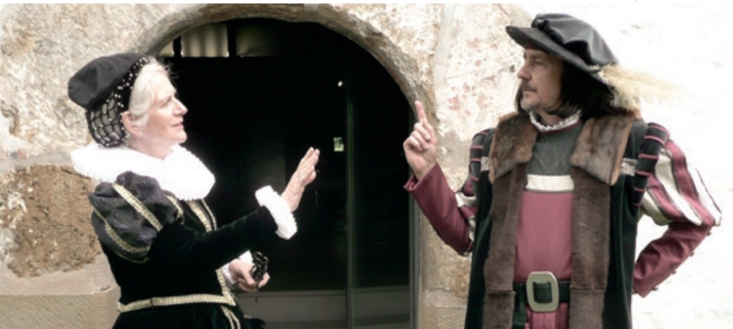
Szene aus historischer Stadtführung